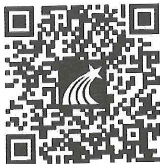
扫一扫下载手机客户端

登录方式：选择“新用户注册”——完善信息[请完整填写学校（或学校名称+研究生院）、学号、姓名信息]——课程——学习——考试。