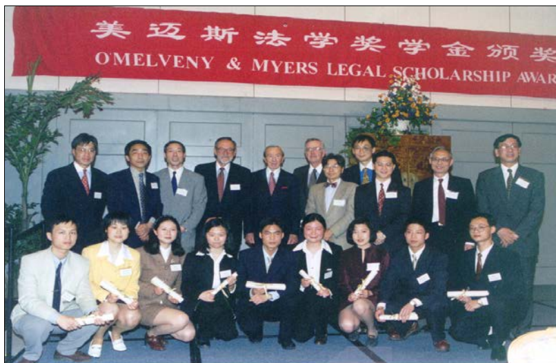
1998 年 5 月，美国前国务卿、美迈斯律师事务所高级合伙人克里斯托弗和美迈斯律师事务所主席、高级合伙人、美迈斯法学奖学金评选委员会全体成员以及第一届美迈斯上海地区法学奖学金获奖者在颁奖典礼上合影留念。

在收到各校报送的材料后，评委会将根据所报材料对候选学生进行初评，从每个学校推荐的 12 名学生中分别选出 6 名学生（其中本科生 3 名，研究生 3 名），即从各校推荐的 36 名候选学生中共选出 18 名学生进行面试。