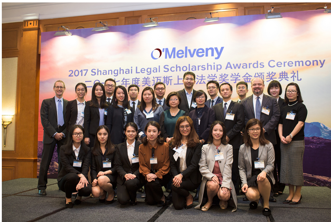
2017 年 11 月，第 20 届美迈斯上海地区法学奖学金颁奖典礼在上海隆重举行。

1998 年，美迈斯律师事务所设立“美迈斯上海地区法学奖学金”，旨在鼓励和资助中国法律专业学生致力于法学学习和研究，协助中国培养优秀法律人才，并增进美中两国法学界的交流与合作。