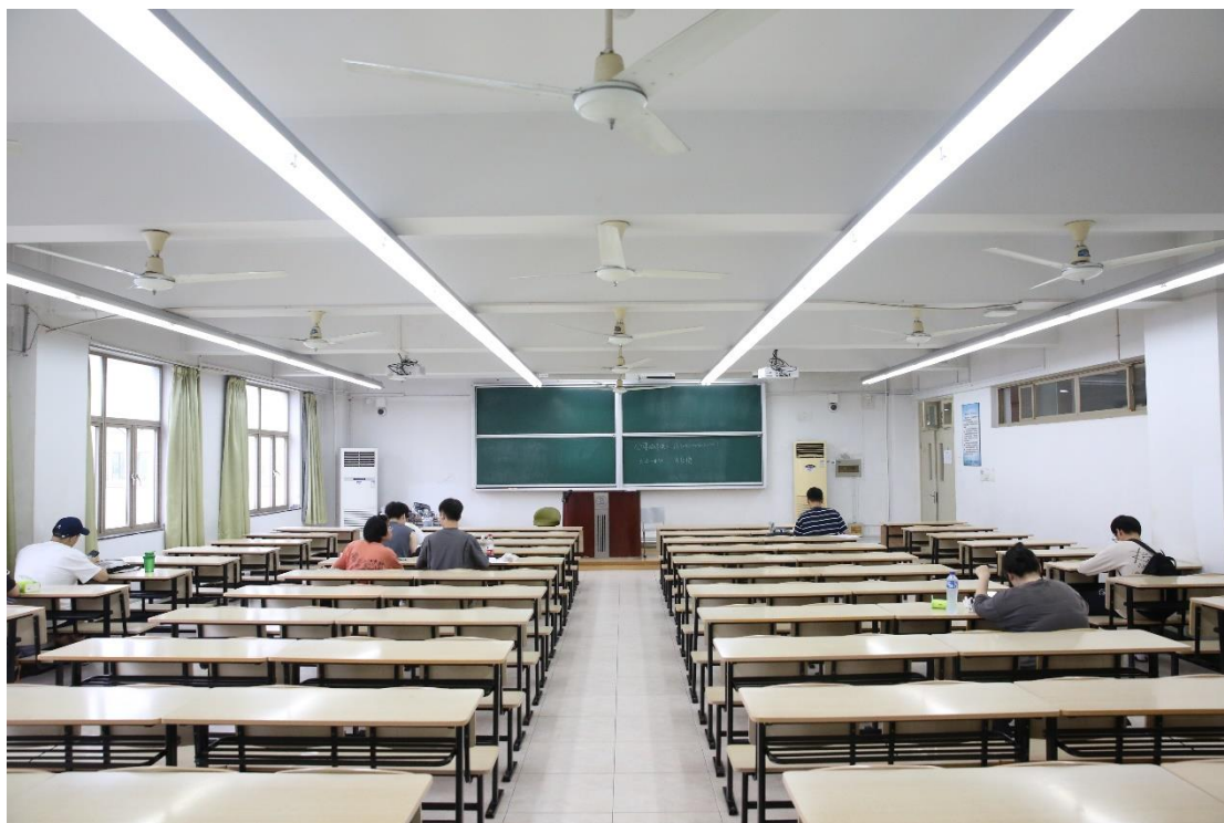
3. 学思楼 D 楼 1 间阶梯型智慧教室示意图: