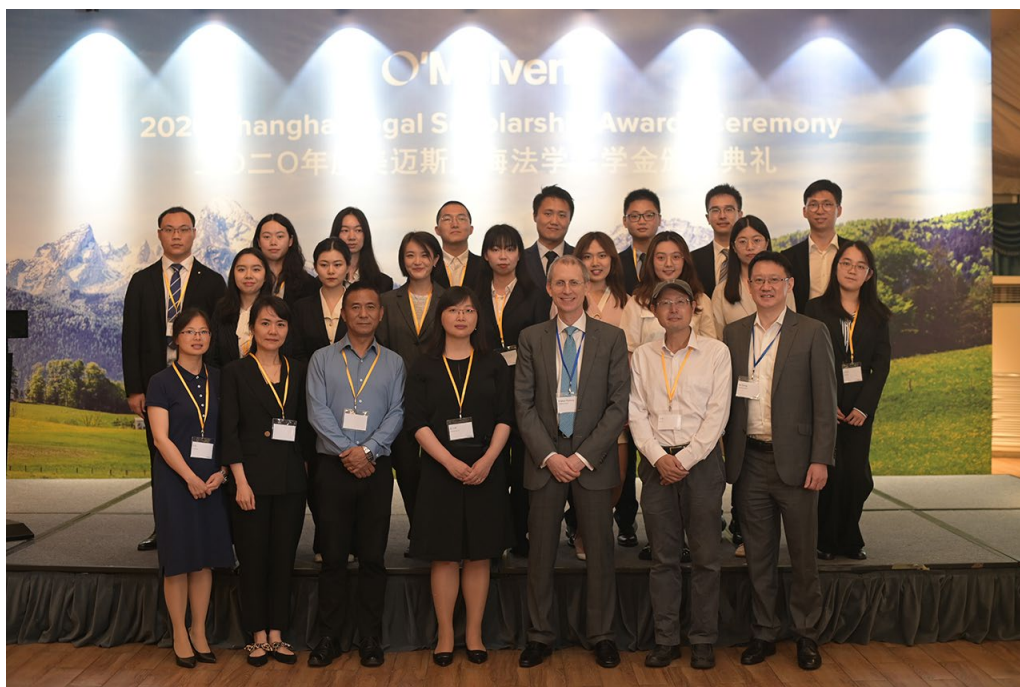
2021 年 6 月，第 23 届美迈斯上海地区法学奖学金颁奖典礼在上海隆重举行。

美迈斯上海地区法学奖学金计划每年评选一次。评选委员会由知名法律界人士、法学教授和美迈斯律师事务所的代表组成，并由评选委员会从复旦大学法学院、华东政法大学、上海交通大学凯原法学院和上海对外经贸大学法学院三年级本科生及二年级研究生（含博士研究生）中评选出 10 名获奖者。