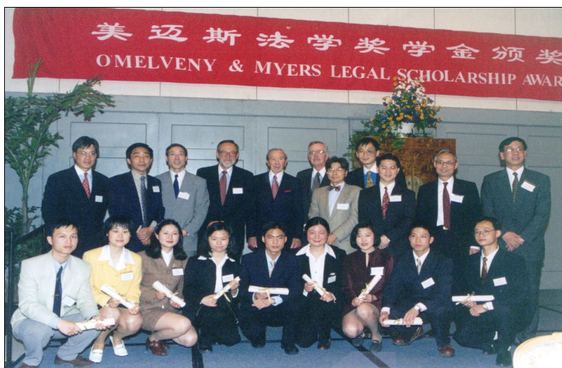
1998 年 5 月，美国已故前国务卿、美迈斯律师事务所前主席、高级合伙人沃伦·克里斯托弗和美迈斯律师事务所主席、高级合伙人、美迈斯法学奖学金评选委员会全体成员以及第一届美迈斯上海地区法学奖学金获奖者在颁奖典礼上合影留念。

在收到各校报送的材料后，评选委员会将根据所报材料对候选学生进行初评，从每所学校推荐的 10 名学生中分别选出 5 名学生（其中本科生 3 名，研究生 2 名），即从各校推荐的 40 名候选学生中共选出 20 名学生进行面试。