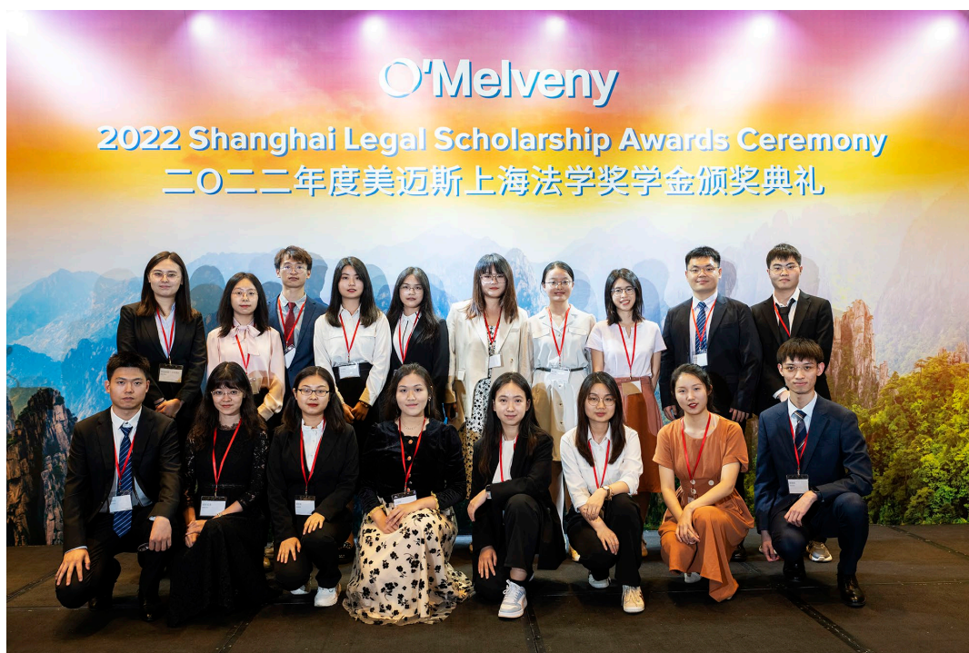
2023 年 5 月，第 25 届美迈斯上海地区法学奖学金颁奖典礼在上海隆重举行。

1998 年，美迈斯律师事务所设立“美迈斯上海地区法学奖学金”，旨在鼓励和资助中国法律专业学生致力于法学学习和研究，协助中国培养优秀法律人才，并增进美中两国法学界的交流与合作。复旦大学法学院、华东政法大学和上海对外经贸大学法学院法律专业学生可以申请该项奖学金。上海交通大学凯原法学院于 2021 年加入该项目。